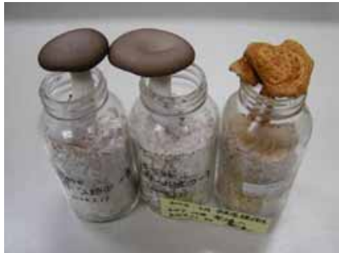
写真1 超低温保存菌株からの子実体発生

ブナ新葉を食害するブナハバチの繭から発生した昆虫寄生菌 Hirsutella sp. (写真3) については、昨年度は分生子からの純粋分離培養と子実体の人工栽培に成功した。そこで、今年度は培養特性の調査検討を行った。その結果、に一般的な昆虫寄生菌培地の酵母シヨ糖サブロー培地や蚕蛹エキス培地では子実体形成は不良であるが、押し麦培地は良好であること、培養1箇月後に培養温度を下げさらに明条件とすることで子実体形成を促進できることが判明した(写真4)。今後は大量増殖が可能かを検討する。