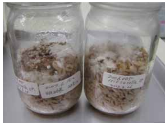
写真5 押し麦培地による子実体人工発生 左：明培養区 右：暗培養区