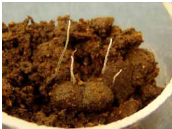
写真4 ハバチ繭から発生した Hirsutella sp.